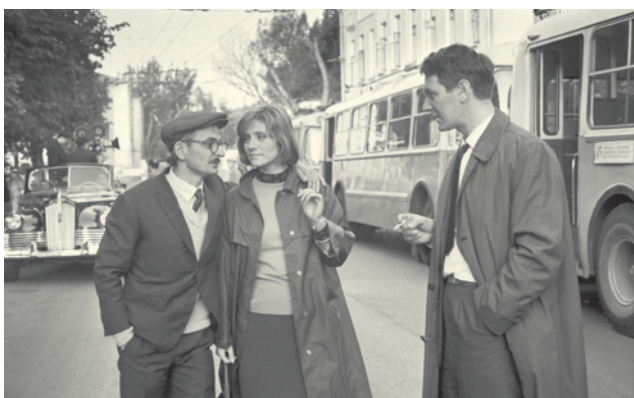
На съёмках «Июльского дождя».