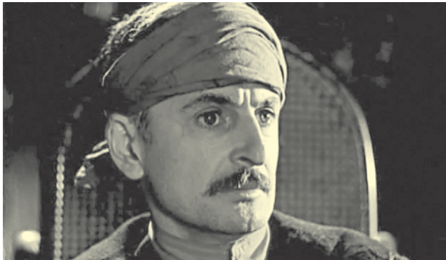
Кадр из фильма «Гори, гори, моя звезда».