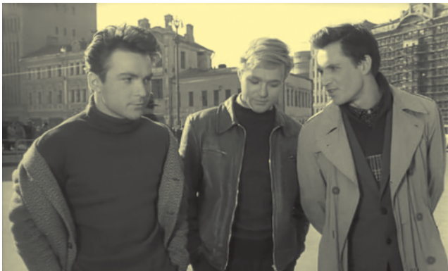
Кадр из фильма «Застава Ильича».

Мемуаров в прямом смысле Марлен Хуциев, кажется, не писал. Но зато регулярно до последнего вёл колонку в журнале «Русский пионер». Это почти мемуары – столь же свободные, как и его кино.