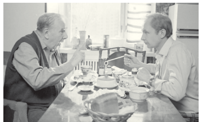
Кадр из фильма «Послесловие».