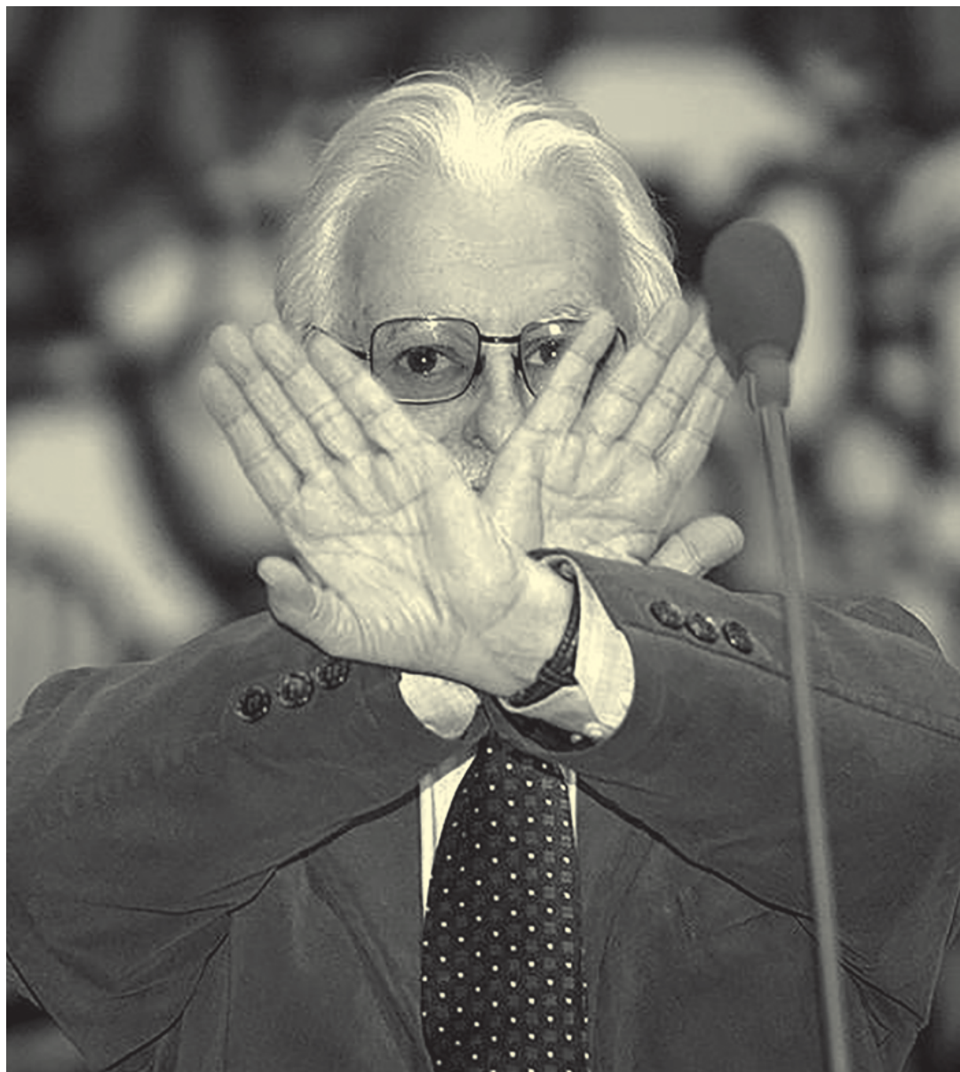
Марлен Хуциев.

«Юрский ходит в хорошо слитых белых игровых штанах, под мышкой пачка «Юманите». Он учит французский на ходу. Красив, собран, стремителен. Читает стихи, собирается ставить «Фиесту» Хемингуэя. Погружён в творчество. На него оглядываются.