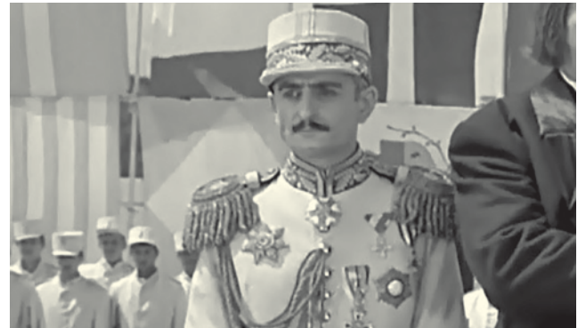
Кадр из фильма «Интервенция».