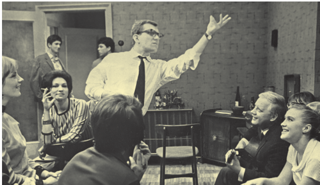
Кадр из фильма «Июльский дождь».