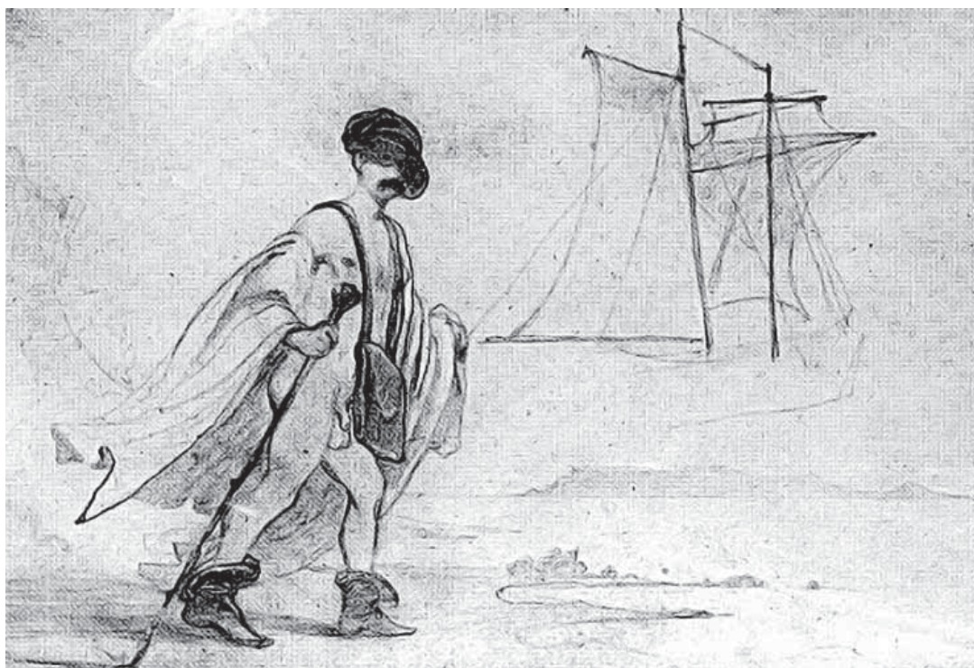
Тарас Шевченко. Автопортрет. 1848-1849 гг.

Альтернативная версия выкупа из крепостных возникла ещё при жизни Шевченко, и он успел отозваться на этот распущенный слух в своём дневнике: «Бездушному Сатрапу и наперснику царя пригрезилось, что я освобождён от крепостного состояния и воспитан на счёт царя, и в знак благодарности нарисовал карикатуру своего благодетеля. Так пускай, дескать, казнится неблагодарный. Откуда эта нелепая басня – не знаю (от Мартоса – Авт.)