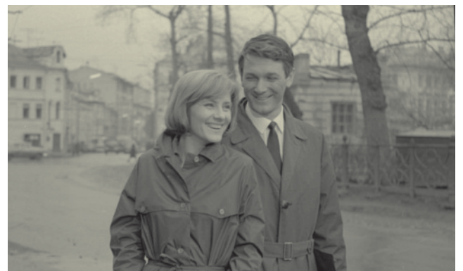
Кадр из фильма «Июльский дождь».