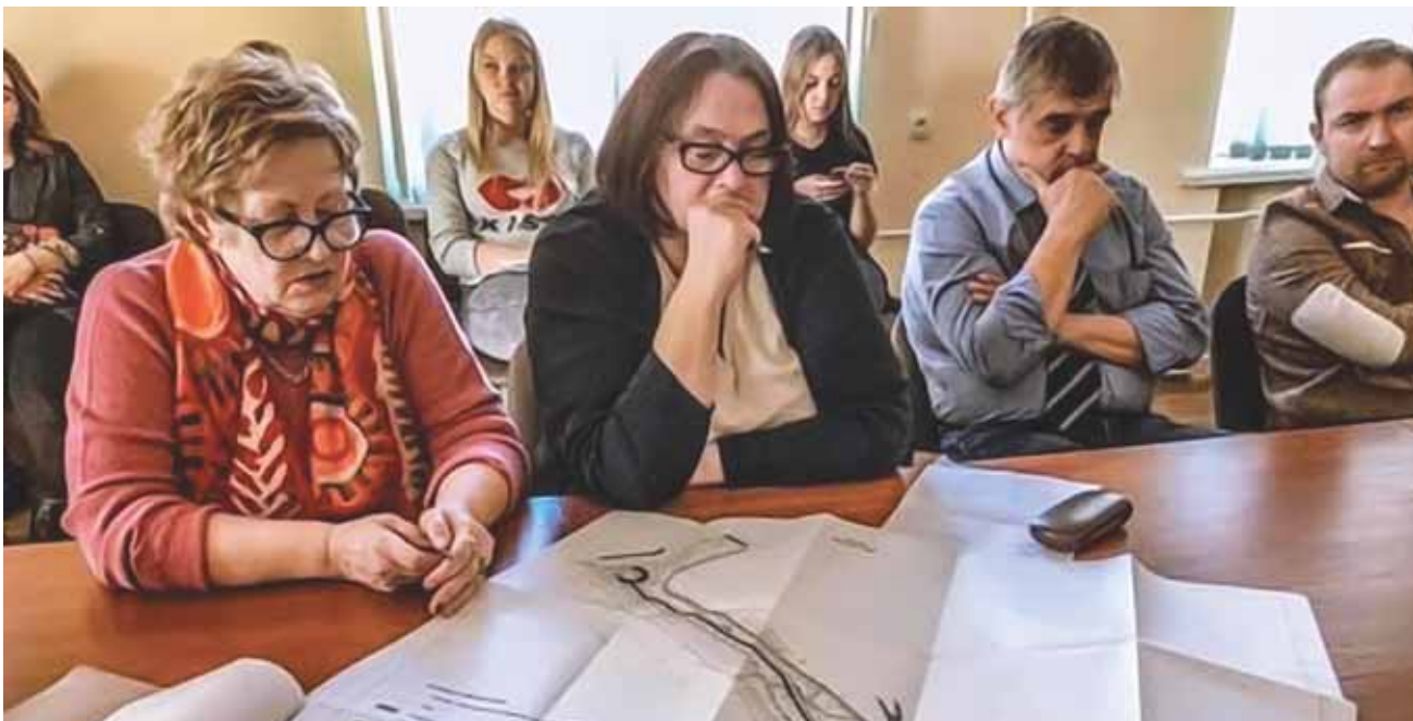
На презентации проекта пешеходного моста через реку Пскову.

Эксперты обсудили эскизный проект пешеходного моста через реку Пскову