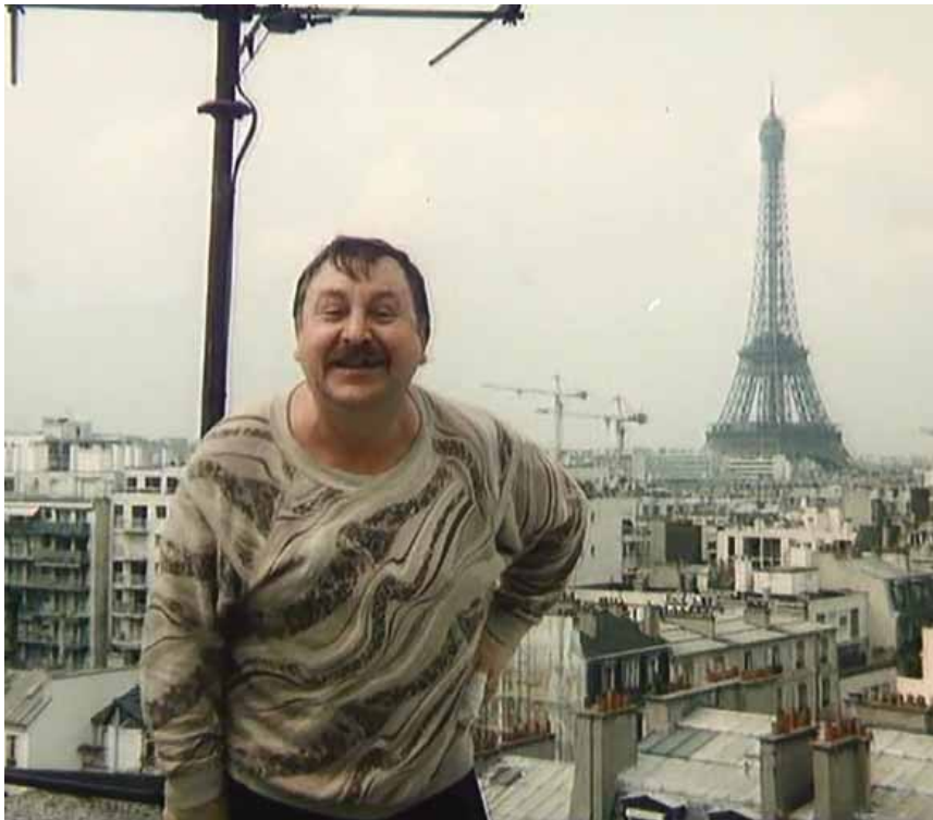
Виктор Михайлов в фильме «Окно в Париж».