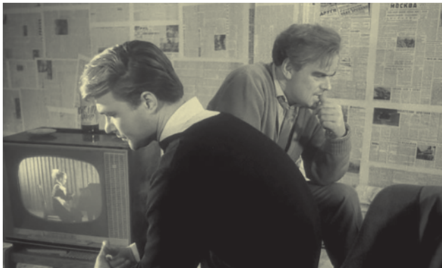
Кадр из фильма «Застава Ильича».